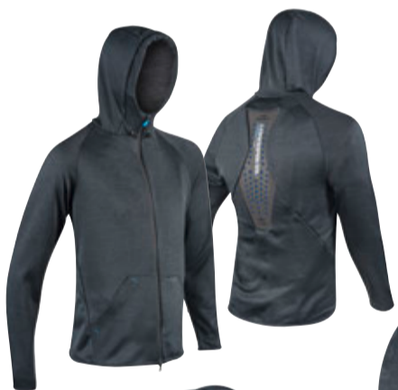
CROSS FLEX PROTEKTOR der sicherste Protektor - EN 1621-2